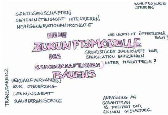
Gruppe 6: Neue Zukunftsmodelle des (gemeinschaftlichen) Bauens – innovativ, ökologisch und bezahlbar