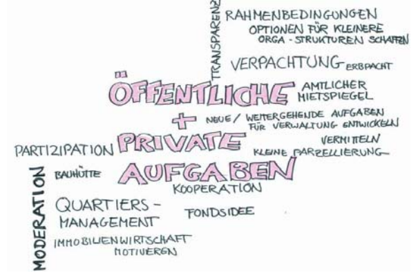
Gruppe 4: Öffentliche und private Aufgaben in der Parkstadtentwicklung