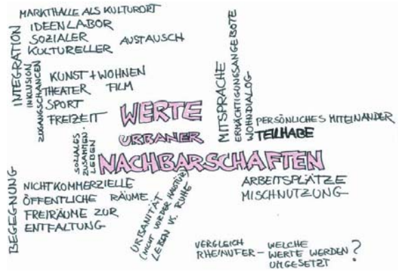
Gruppe 2: Werte urbaner Nachbarschaften