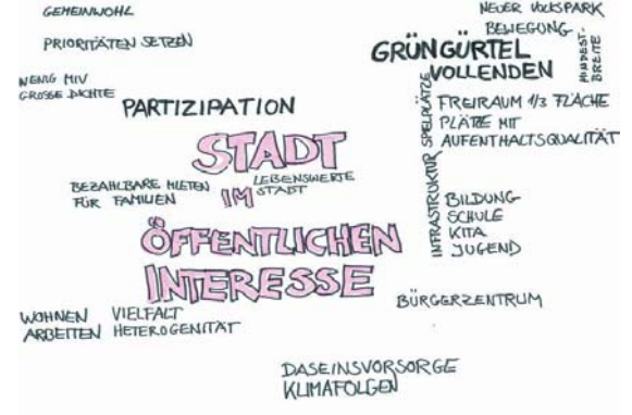
Gruppe 3: Stadt im öffentlichen Interesse