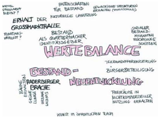
Gruppe 5: Wertebalance – zwischen Bestandsschutz und Neuentwicklung