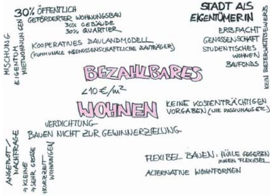
Gruppe 1: Bezahlbares Wohnen